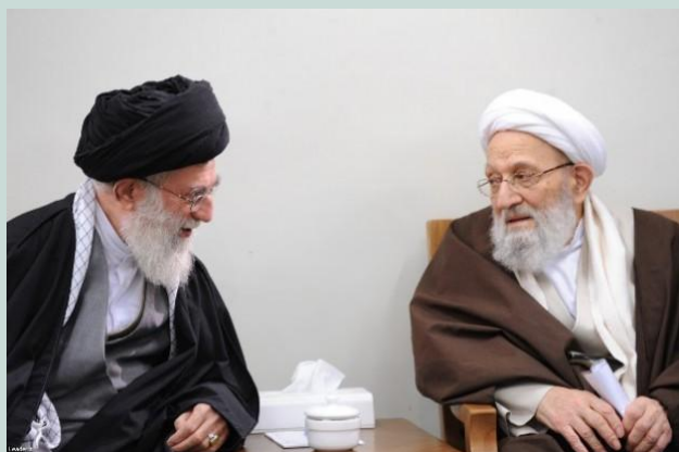
איתאללה מהדוי כני לצד עלי ח'אמנהאי

מאז ההודעה ב-4 ביוני 2014 על ההידרדרות החמורה במצבו הרפואי של האיתאללה מוחמד-רזא מהדוי כני (נולד ב-1931) עוקבים חוגי המשטר והתקשורת באיראן בדריכות רבה אחר מצבו. למרות זאת, מועטים הם הדיווחים היוצאים מאיראן אודות ההיערכות של חוגי המשטר להיעדרותו מהזירה הפוליטית במדינה ובנוגע למשמעויות הפוליטיות החשובות שנגזרות מכך. לכתו של איתאללה מהדוי כני, הנחשב למקורבו של המנהיג עלי ח'אמנהאי, מערימה קושי רגיש למשטר ובמיוחד לח'אמנהאי, לאור תפקידו המרכזי והרגיש של איתאללה מהדוי כני כיו"ר מועצת המומחים. 1 שכן, שינוי כלשהו בהרכב צמרת המועצה, עלול להשפיע על מידת פיקוחה על ח'אמנהאי ועל החלטותיה בעניין סוגיות מכריעות במשטר, המתקבלות בכינוסיה הדו שנתיים, הנערכים מאחורי דלתיים סגורות.