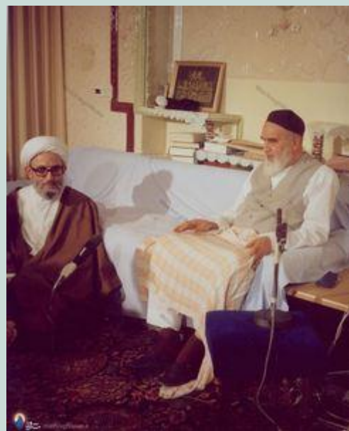
איתאללה מהדוי כני לצד איתאללה עט'מא רוחאללה ח'ומיני